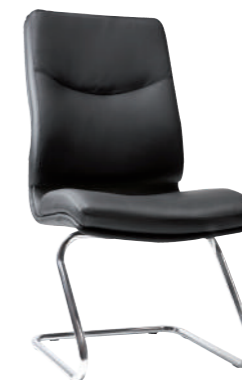
ZETA EXECUTIVE CHAIR